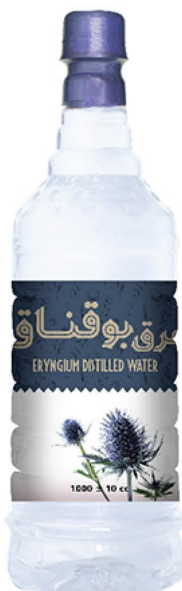
عرق بوقناق حجم بطری: یک لیتر کیفیت: ممتاز