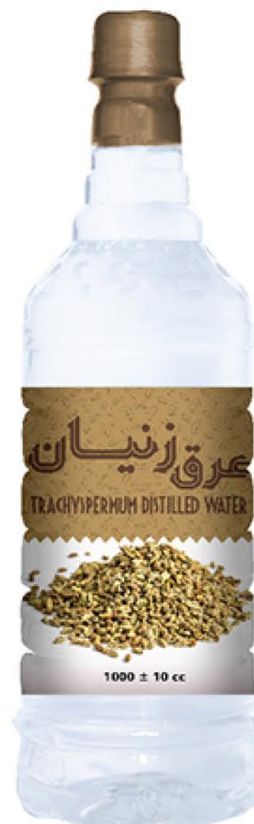
عرق زنیان حجم بطری: یک لیتر کیفیت: ممتاز