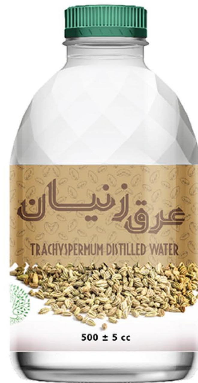
عرق زنیان حجم بطری: نیم لیتر رویال کیفیت: گرید دارویی