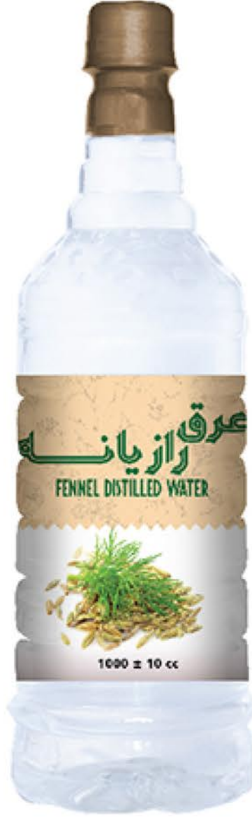
عرق رازیانه حجم بطری: یک لیتر کیفیت: ممتاز