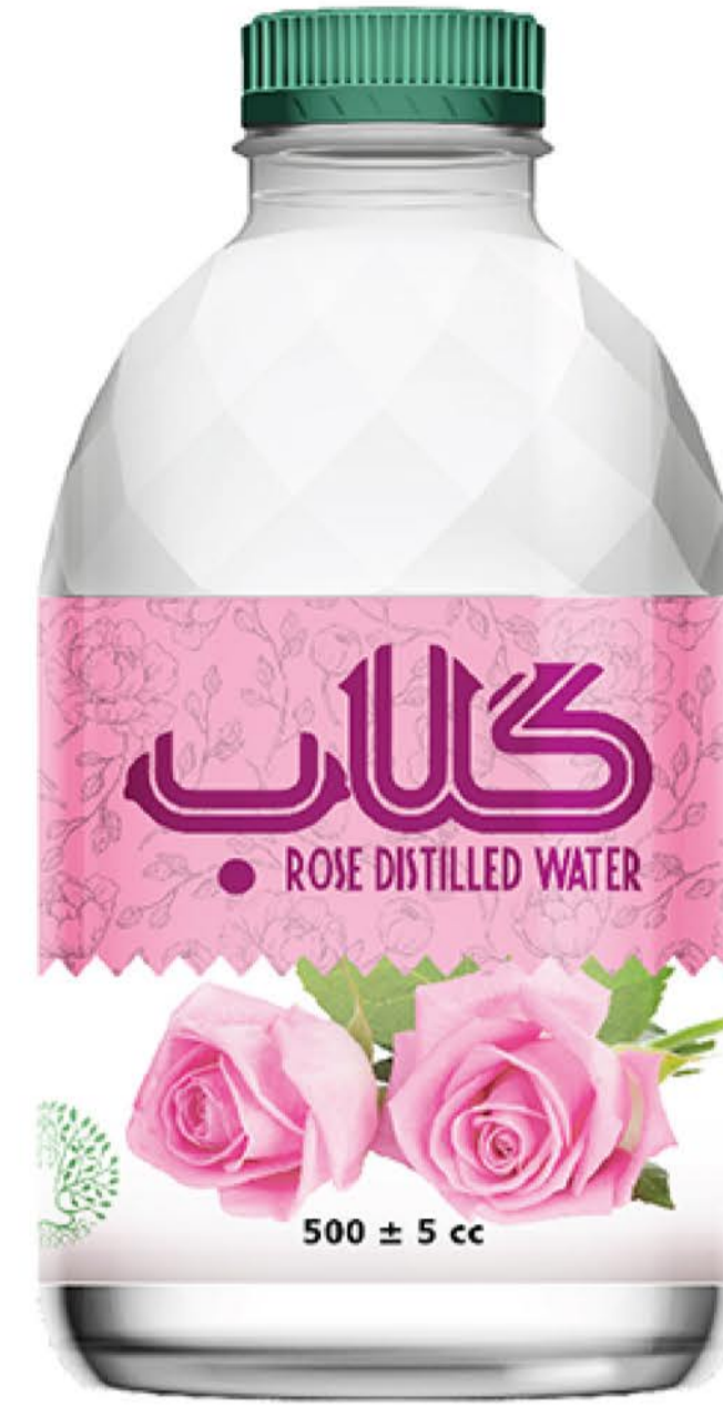
گلاب حجم بطری: نیم لیتر رویال کیفیت: گرید دارویی