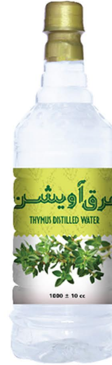
عرق آویشن حجم بطری: یک لیتر کیفیت: ممتاز