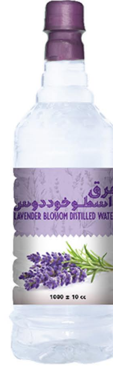
عرق اسطوخودوس حجم بطری: یک لیتر کیفیت: ممتاز