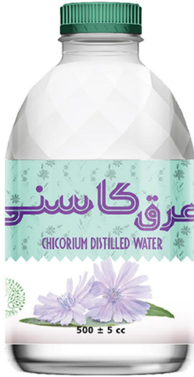
عرق کاسنی حجم بطری: نیم لیتر رویال کیفیت: گرید دارویی