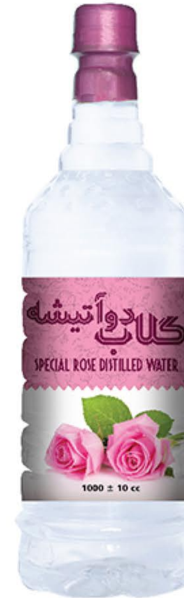
گلاب دو آتیشه حجم بطری: یک لیتر کیفیت: ممتاز