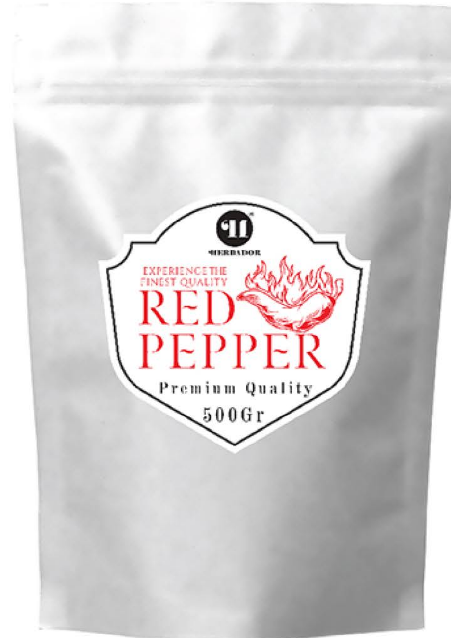
پودر فلفل قرمز حجم پاکت: ۵۰۰ گرم کیفیت: ممتاز