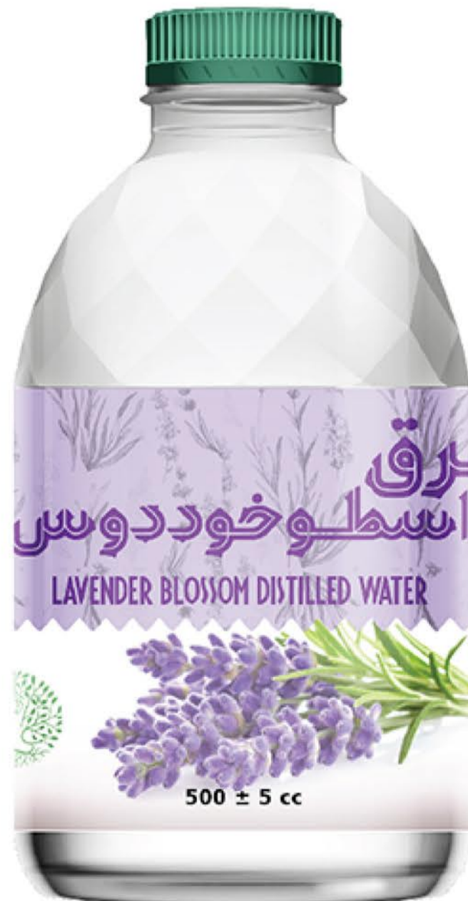
عرق اسطوخودوس حجم بطری: نیم لیتر رویال کیفیت: گرید دارویی