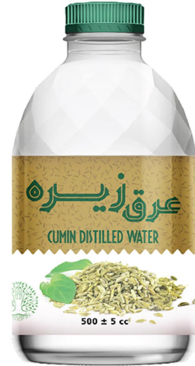
عرق زیره حجم بطری: نیم لیتر رویال کیفیت: گرید دارویی