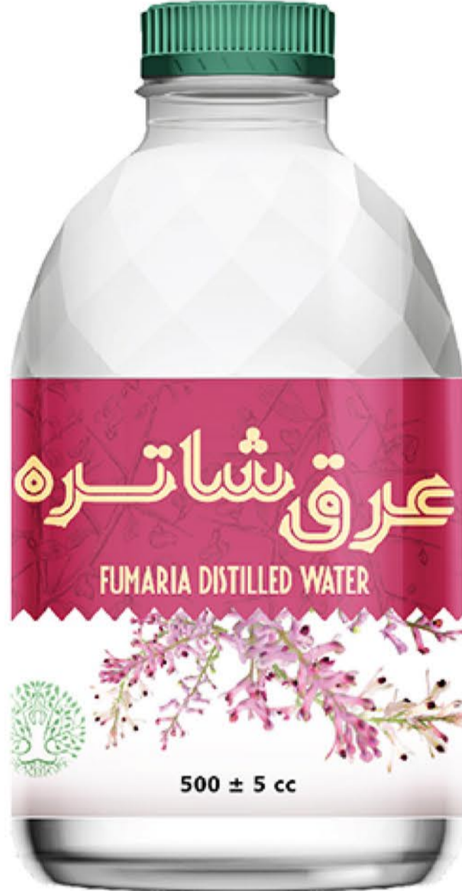
عرق شاتره حجم بطری: نیم لیتر رویال کیفیت: گرید دارویی