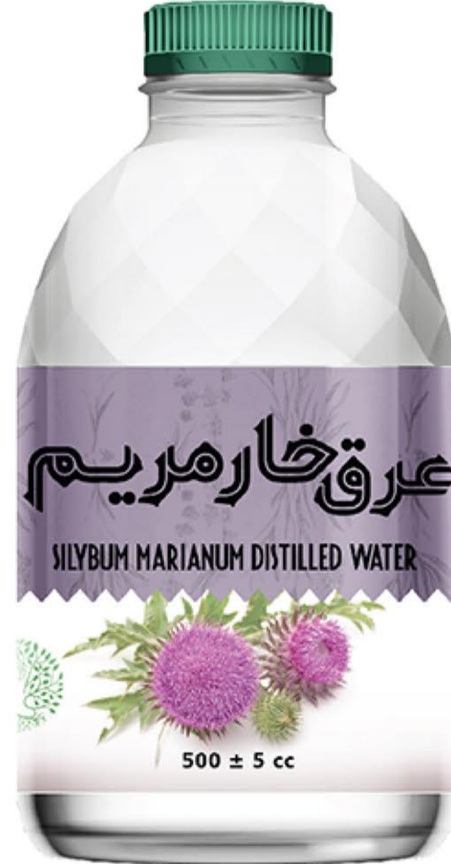
عرق خارمریم حجم بطری: نیم لیتر رویال کیفیت: گرید دارویی