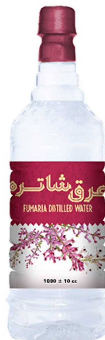
عرق شاتره حجم بطری: یک لیتر کیفیت: ممتاز