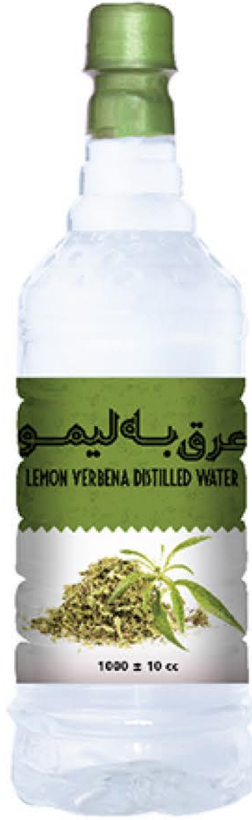
عرق به لیمو حجم بطری: یک لیتر کیفیت: ممتاز