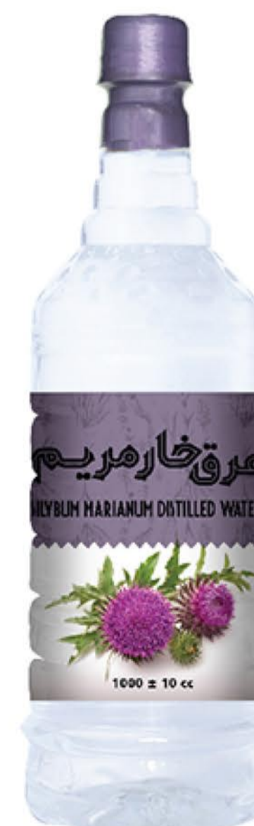
عرق خارمریم حجم بطری: یک لیتر کیفیت: ممتاز