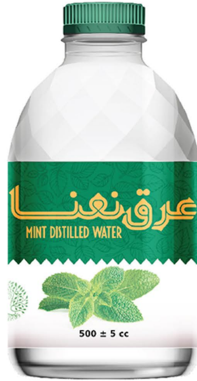
عرق نعنا حجم بطری: نیم لیتر رویال کیفیت: گرید دارویی