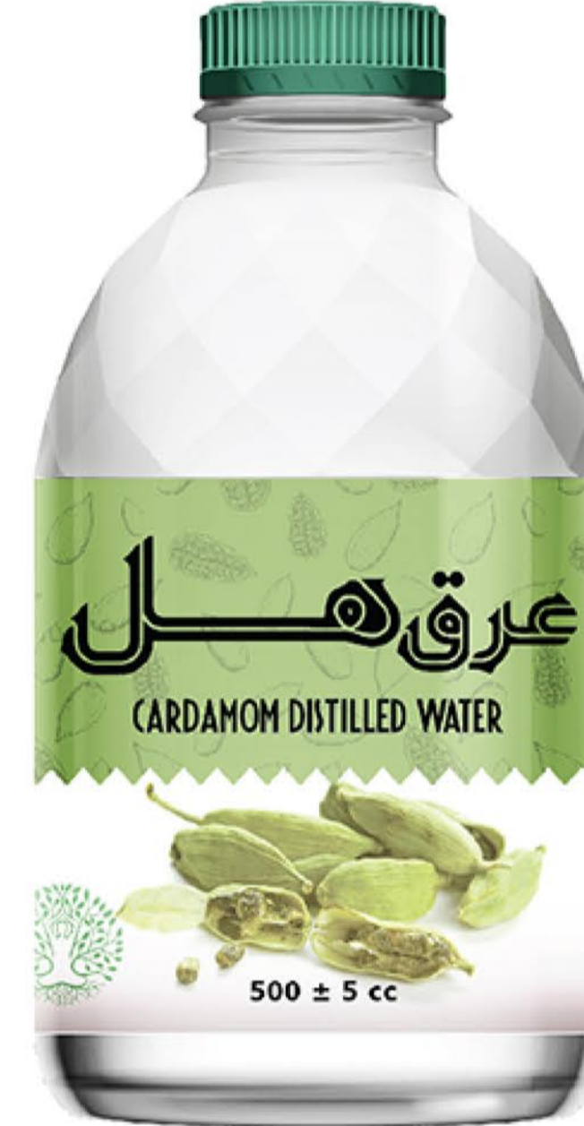
عرق هل حجم بطری: نیم لیتر رویال کیفیت: گرید دارویی