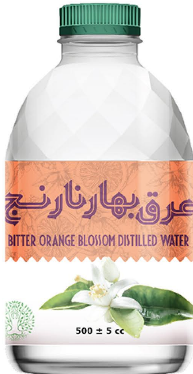
عرق بهار نارنج حجم بطری: نیم لیتر رویال کیفیت: گرید دارویی