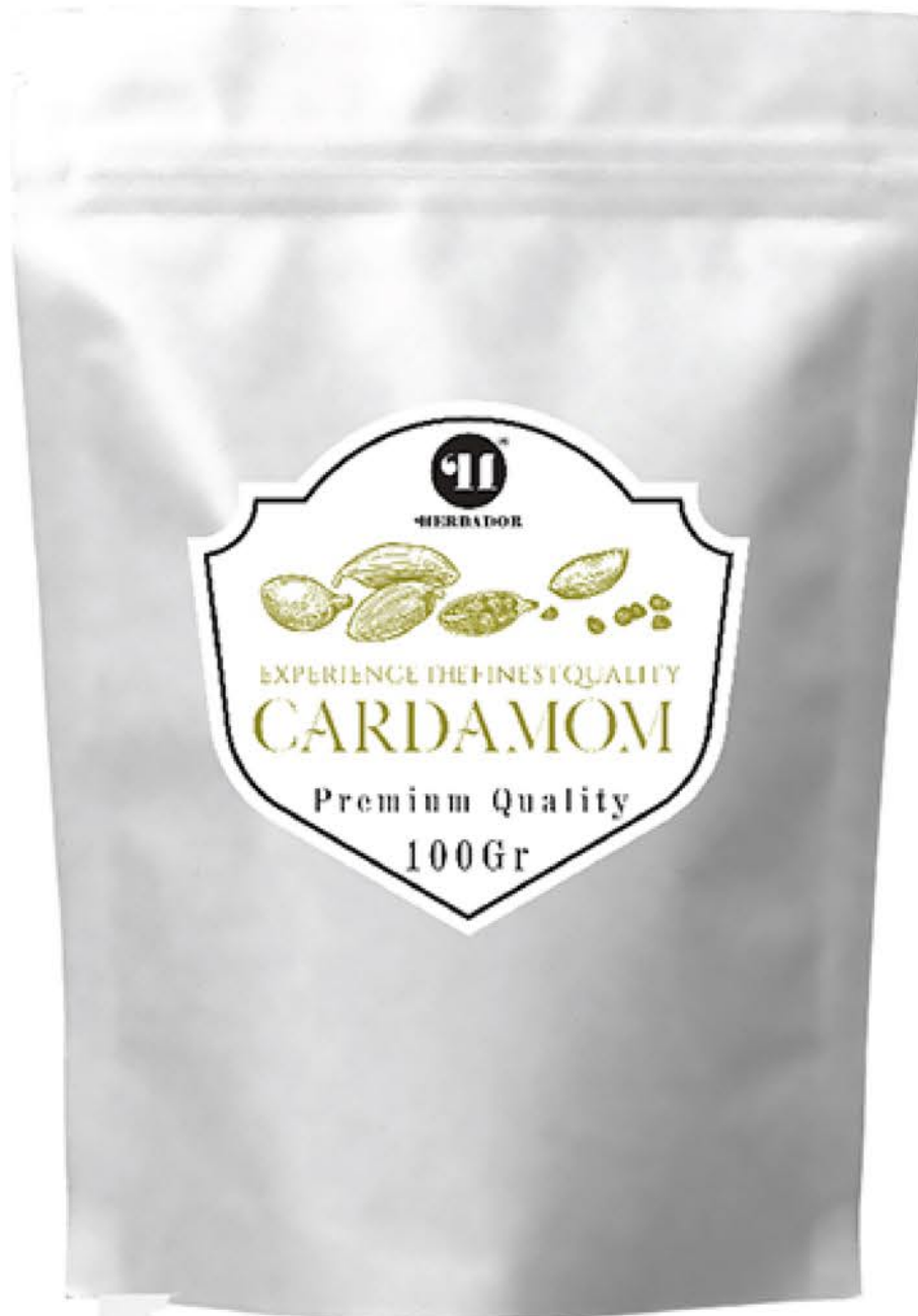
هل سبز حجم پاکت: ۱۰۰ گرم کیفیت: ممتاز