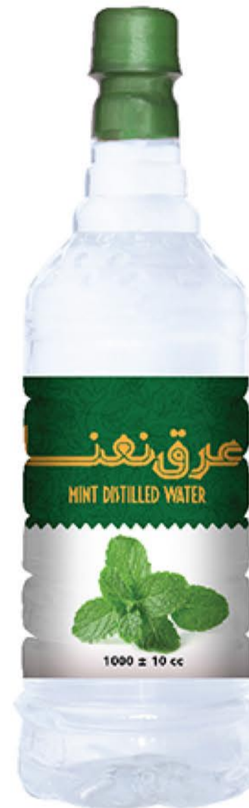
عرق نعنا حجم بطری: یک لیتر کیفیت: ممتاز