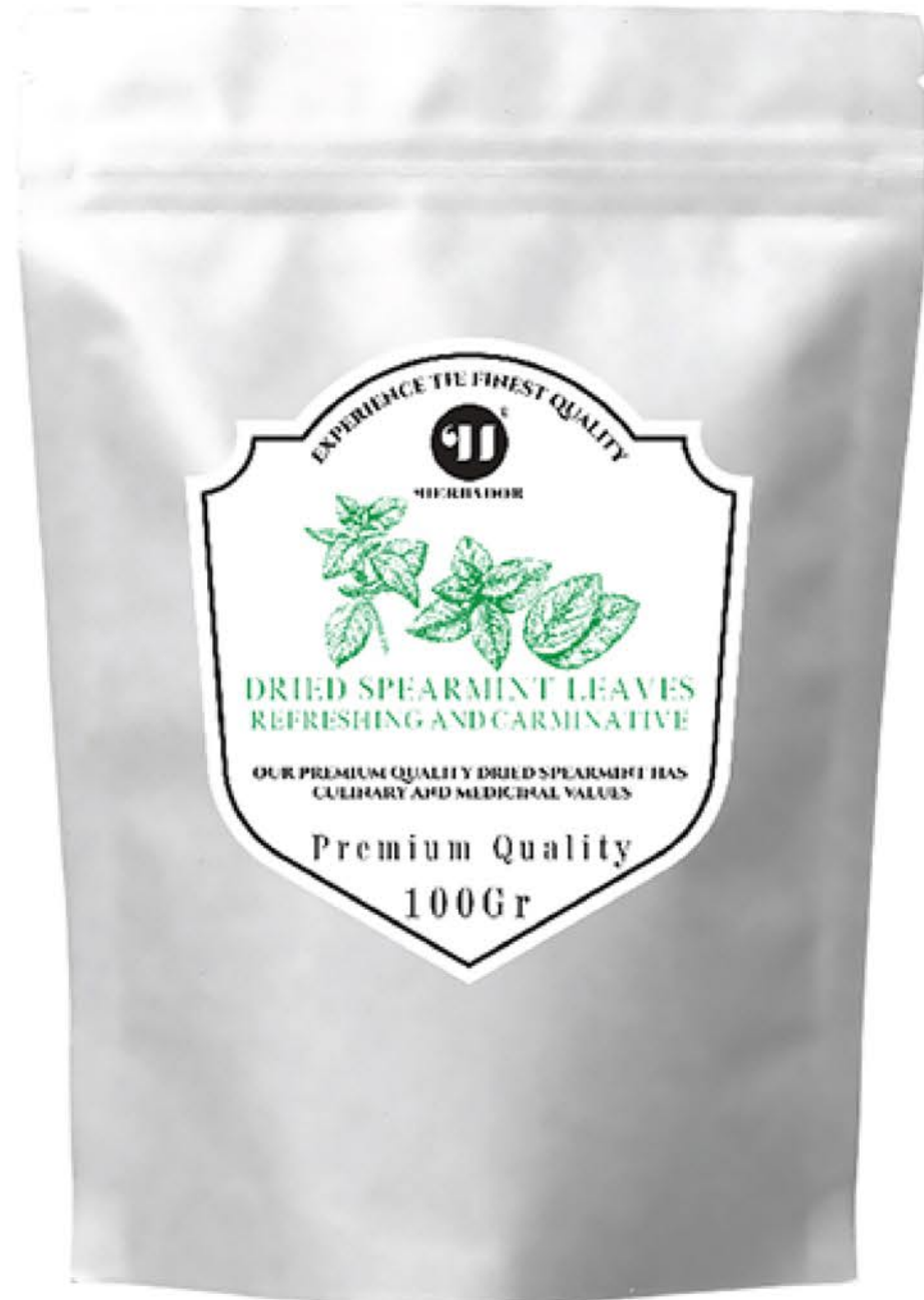
برگ نعناء حجم پاکت: ۱۰۰ گرم کیفیت: ممتاز