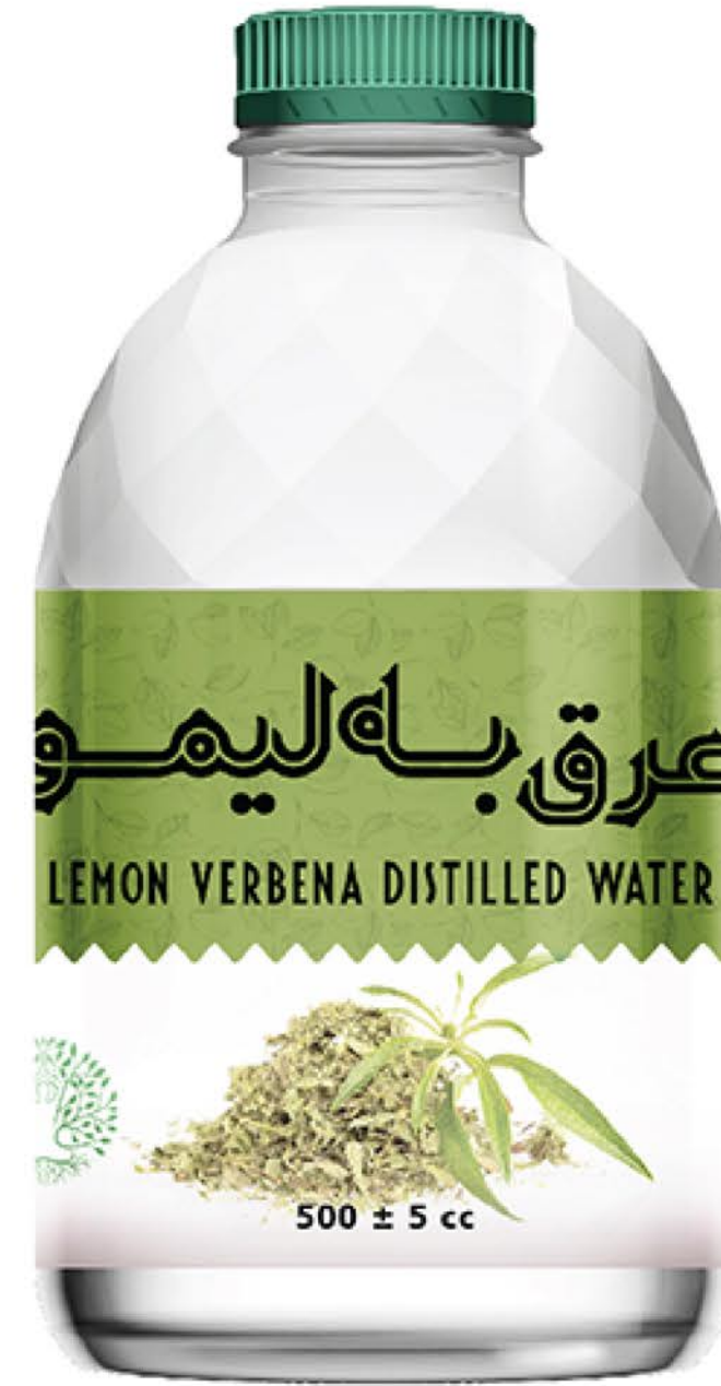
عرق به لیمو حجم بطری: نیم لیتر رویال کیفیت: گرید دارویی