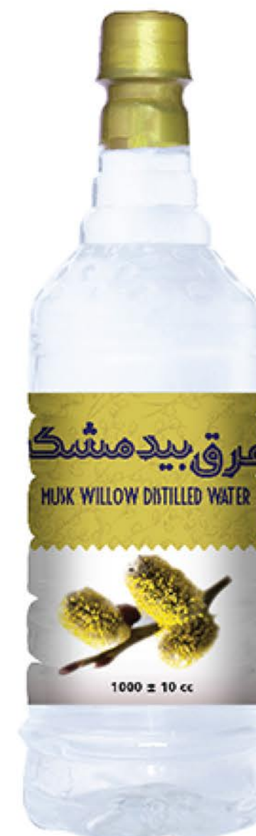
عرق بیدمشک حجم بطری: یک لیتر کیفیت: ممتاز