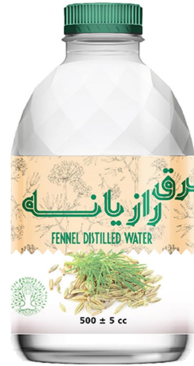
عرق رازیانه حجم بطری: نیم لیتر رویال کیفیت: گرید دارویی