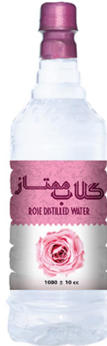
گلاب ممتاز حجم بطری: یک لیتر کیفیت: ممتاز