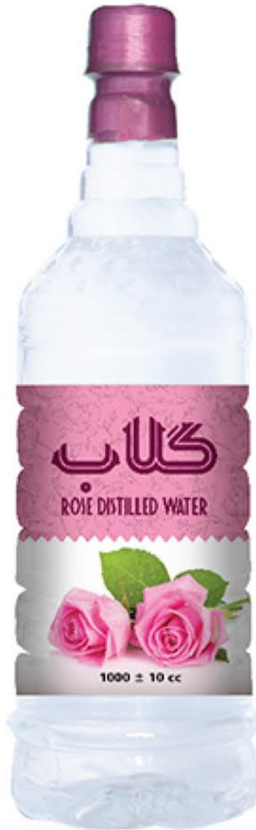
گلاب حجم بطری: یک لیتر کیفیت: ممتاز