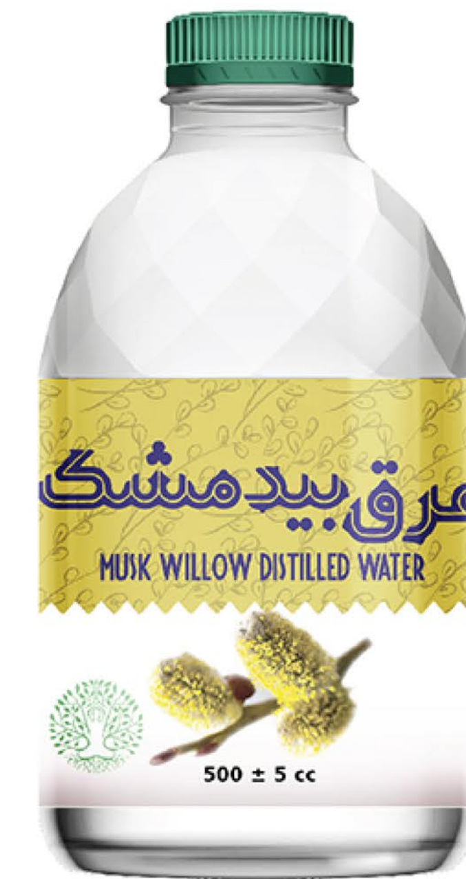
عرق بیدمشک حجم بطری: نیم لیتر رویال کیفیت: گرید دارویی