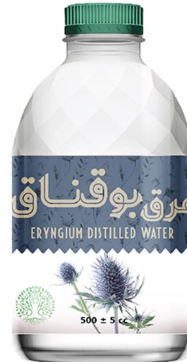
عرق بوقناق حجم بطری: نیم لیتر رویال کیفیت: گرید دارویی