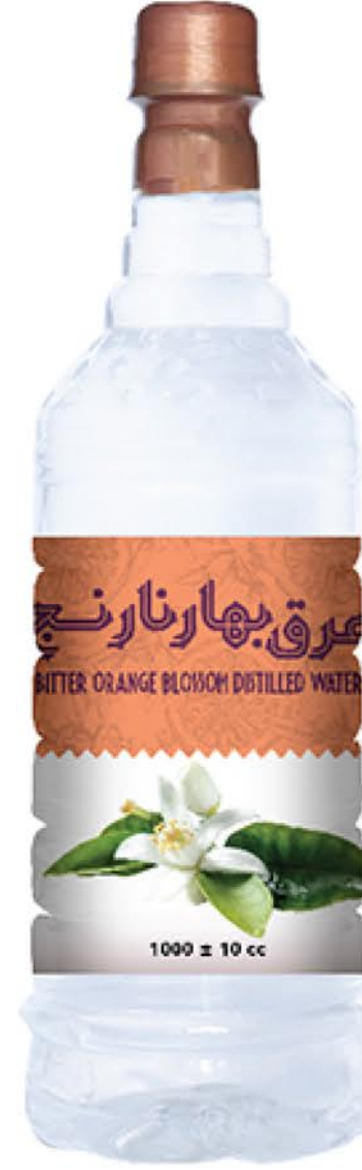
عرق بهار نارنج حجم بطری: یک لیتر کیفیت: ممتاز