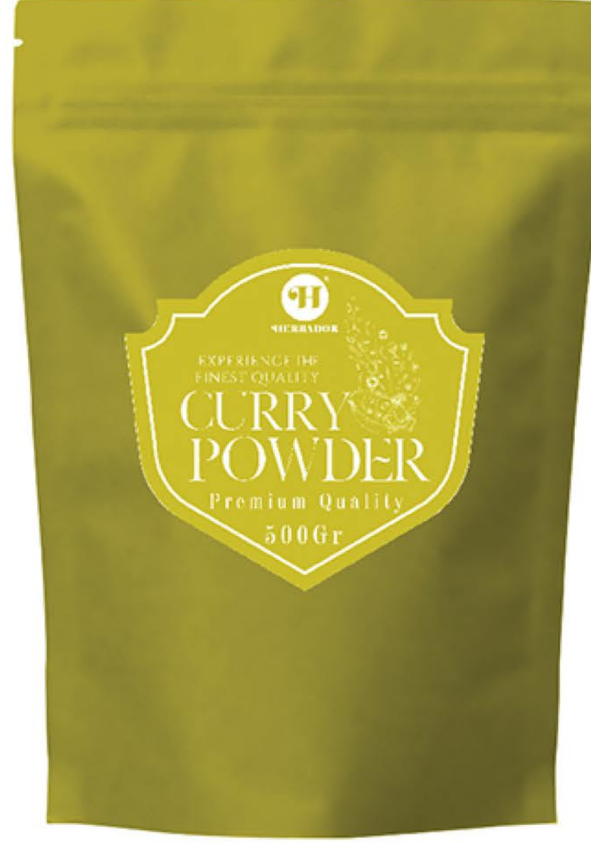
پودر کاری حجم پاکت: ۵۰۰ گرم کیفیت: ممتاز