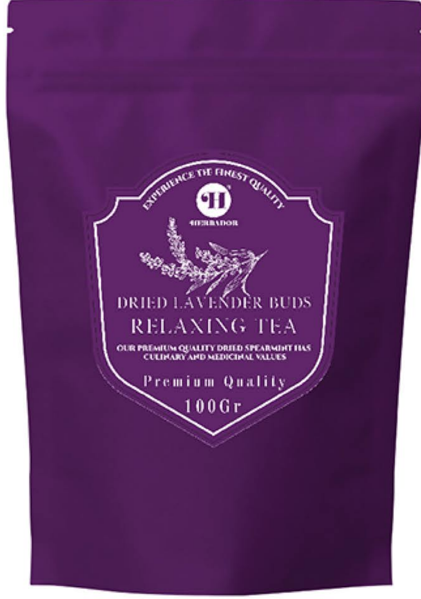
شکوفه لوندر حجم پاکت: ۱۰۰ گرم کیفیت: ممتاز