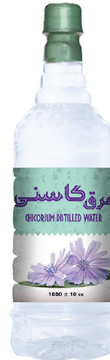
عرق کاسنی حجم بطری: یک لیتر کیفیت: ممتاز