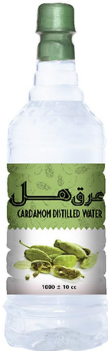
عرق هل حجم بطری: یک لیتر کیفیت: ممتاز