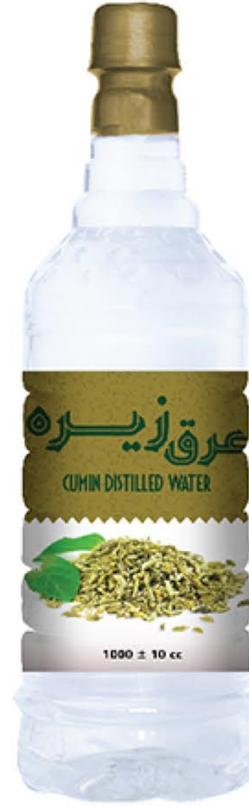
عرق زیره حجم بطری: یک لیتر کیفیت: ممتاز