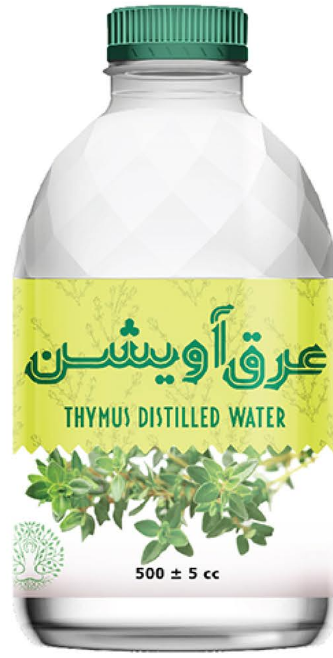
عرق آویشن حجم بطری: نیم لیتر رویال کیفیت: گرید دارویی