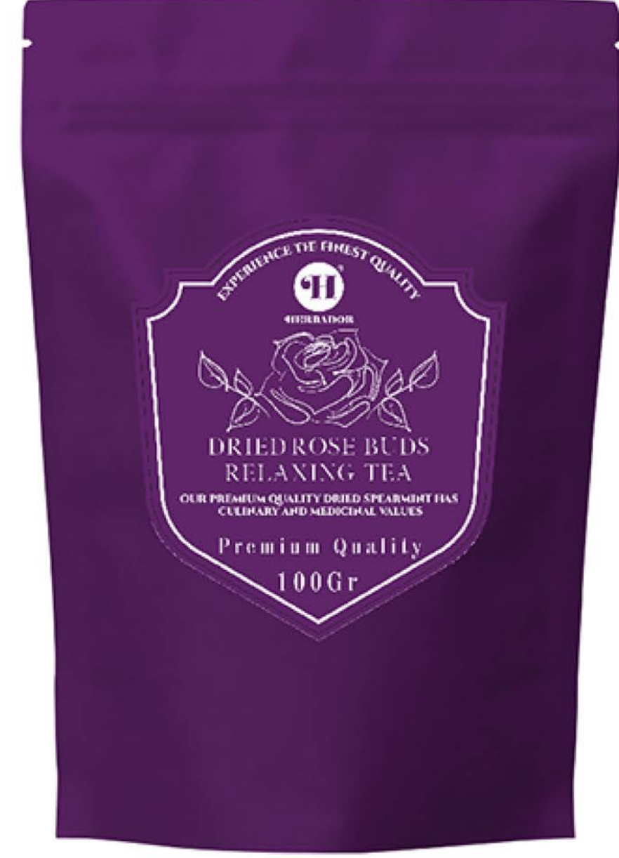
غنچه گل محمدی حجم پاکت: ۱۰۰ گرم کیفیت: ممتاز